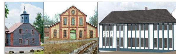
MINT-Campus Alte Schmelz